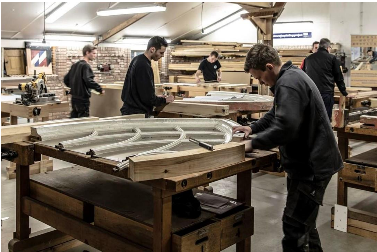
Het praktijkcentrum voor restauratie en ambacht van RIBO / ROP-Oost.