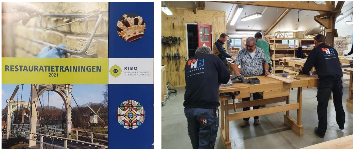
RIBO / ROP-Oost heeft een ruim aanbod aan praktijkgerichte restauratietrainingen ontwikkeld.

Soms gaan personen zelf op zoek om zich te bekwamen op het restauratievakgebied. Dan moet er wel een aanbod van cursussen zijn, en bovenal leren in de praktijk. ROP-Oost heeft hierop ingespeeld.