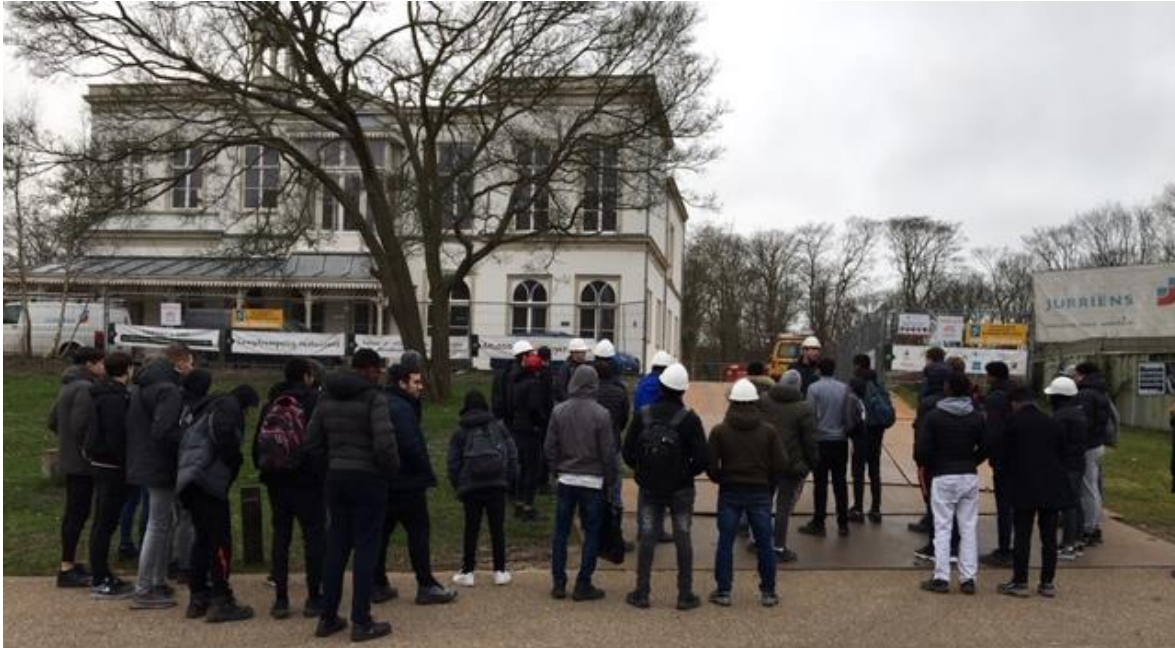
Leerlingen bezoeken een project van ROP-ZW.

wat 'meer' ontstaan. Zo kan 'leren in de praktijk', waar ROP voor staat, toch de opstap worden voor een nieuwe restauratievakman in spe.