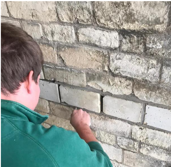
ROP-Middenwest: leren in de praktijk.

Daarnaast heeft NCE een eigen keuzedeel ontwikkeld, waaraan een fors hoger prijskaartje hangt (€ 750,- excl. btw). In enkele gebieden bekostigen de restauratiebedrijven de deelname aan dit keuzedeel. Momenteel gebruiken de meeste ROC's en opleidingsbedrijven (Bouwmensen) het keuzedeel van Concreet. In de noordelijke provincies is een variant, die meer is toegesneden op de eigen regio (bijvoorbeeld streekeigen bouwen), op het keuzedeel van Concreet ontwikkeld. In Limburg heeft men een geheel eigen keuzedeel ontwikkeld.