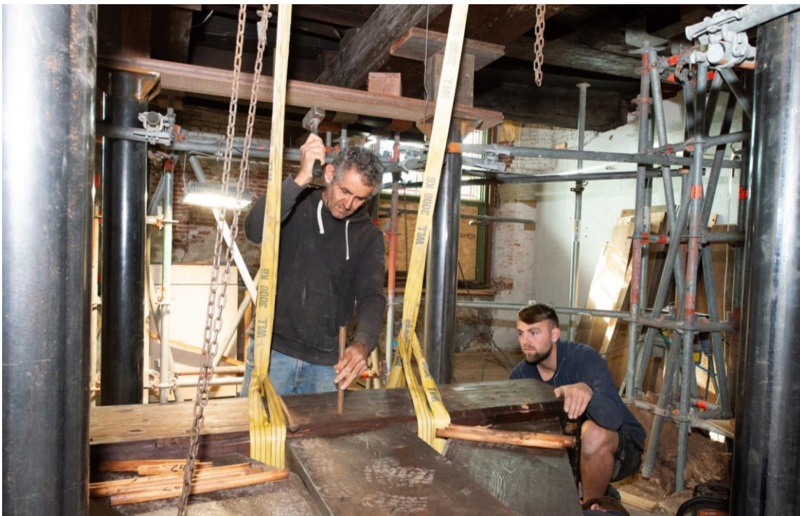
ROP-Noord Nederland: een leermeester en leerling op een restauratieproject in Bolsward.

In de provincies Zuid-Holland, Noord-Brabant en Limburg wordt het creëren van leerling-werkplekken door het provinciebestuur gestimuleerd door dit als criterium op te nemen in de rangschikking bij het toekennen van restauratiesubsidie voor rijksmonumenten.