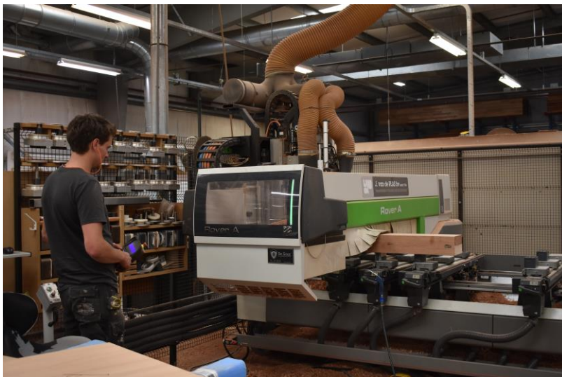
Een moderne CNC-machine, die onder meer gebruikt wordt voor restauratiewerk.

ROP stimuleert kennis vernieuwing en kennisoverdracht binnen de restauratiesector. Zeker als het gaat om de combinatie van oud en nieuw. Binnen de restauratie-opleiding THR van ROP Oost / RIBO maakt innovatie een vast onderdeel uit van het leerprogramma. Dat de andere ROP-regio's zo enthousiast zijn over deze opleiding, heeft onder andere hier mee te maken. De leerlingen die deze opleiding hebben gevolgd hebben allen de potentie in zich om uit te groeien tot excellente werknemers. Dat is goed voor het toekomstperspectief van deze personen, maar vooral ook voor de bouw- en restauratiesector.