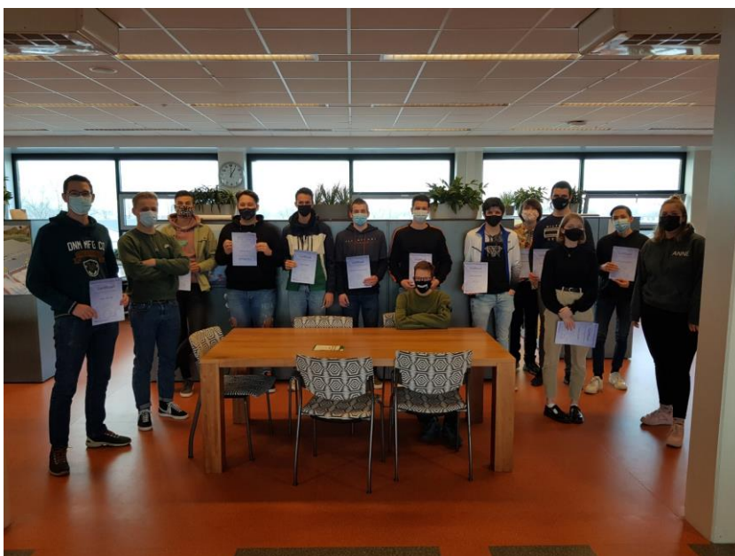
ROP Zuid West: leerlingen – met mondkapjes – bij uitreiking certificaat keuzedeel 'Basis restauratie Timmeren'.

Meerdere ROC's bieden het keuzedeel 'Basis restauratie Timmeren / Metselen' als onderdeel van de allround opleiding timmeren of metselen. Het is een pover geste om nog iets te doen op het gebied van restauratie. Maar beter iets dan niets. Daarom promoot ROP dit keuzedeel volop. Er is een variant aangeboden door NCR, en een door Concreet Onderwijsproducten.