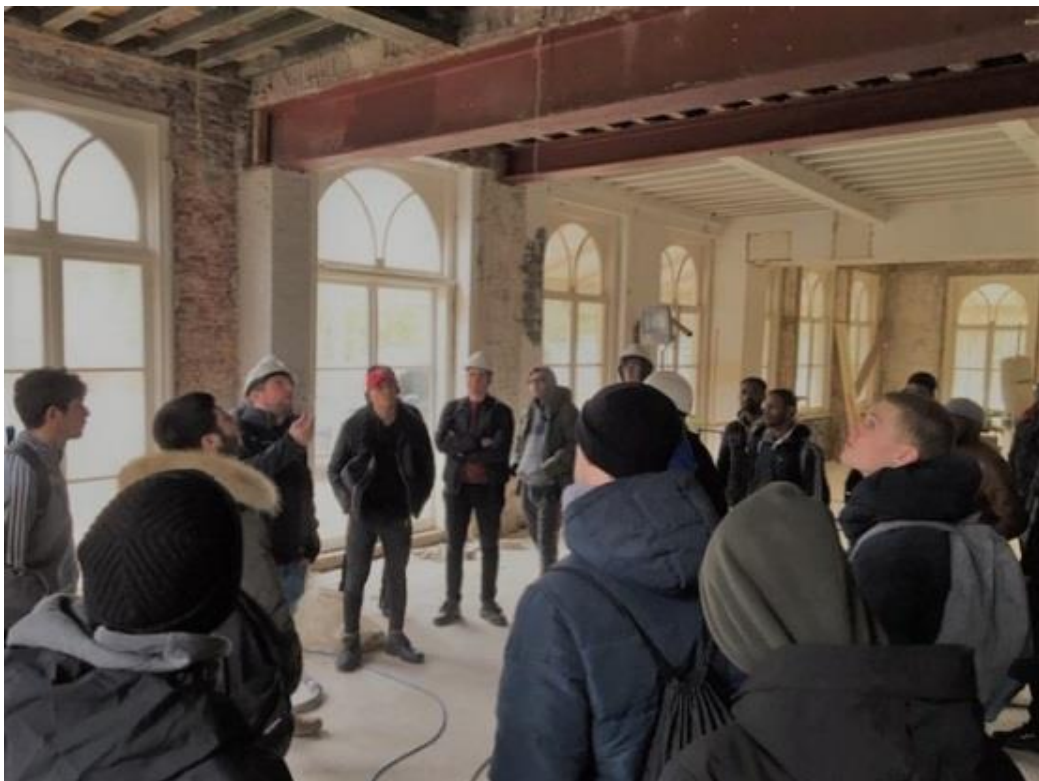
ROP Zuid West: ROP-excursie naar buitenplaats Ockenburgh in Den Haag als afsluiting van een masterclass over bouwfysica en het isoleren van koudebruggen..