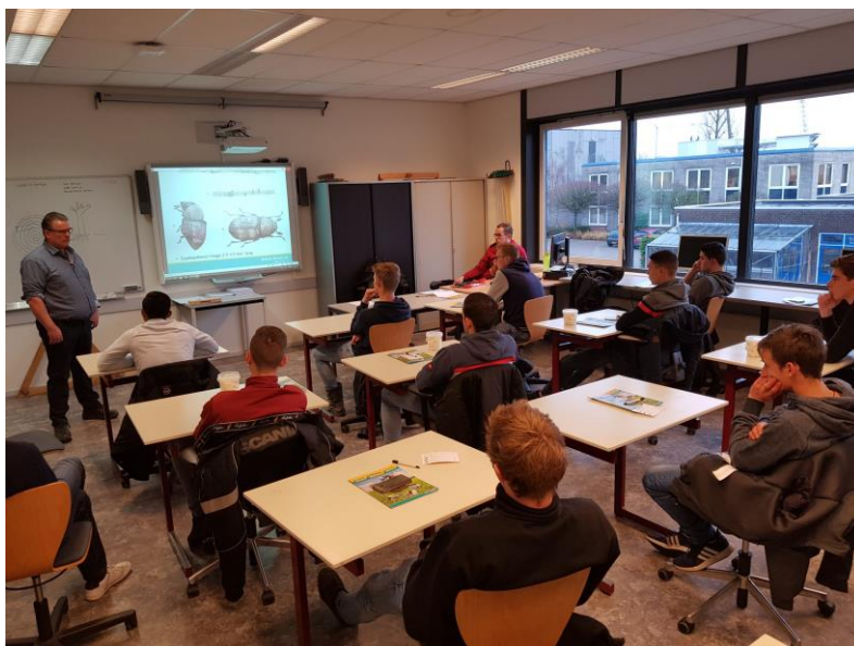
ROP Zuid West: masterclass voor BOL-4 leerlingen bij Scalda in Vlissingen