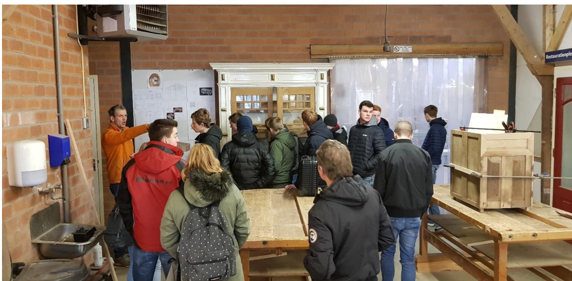
Voorlichting: VMBO-scholen op bezoek in het Praktijkcentrum Restauratie en Ambacht van ROP Oost / RIBO.

Het succes van de aanpak van RIBO / ROP Oost in hun PRA is zo overweldigend, dat een uitbreiding nodig is. Hierbij is de insteek om in de komende tijd nog meer in te zetten op innovatie, houttechnologie en het bevorderen van product vernieuwing.