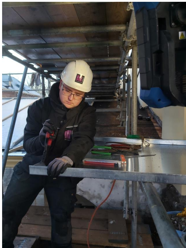
ROP Zuid: kapel Saint Louis in Oudenbosch met rechts een leerling dakdekkers.