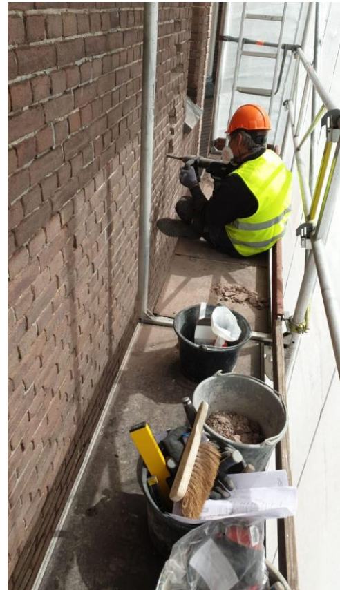
ROP Zuid West: een leerling aan het

In Overijssel is de provincie nauw betrokken bij de plannen om het PRA uit te breiden. De provincie en de stad Utrecht hebben met de restauratie van de Domtoren een voorbeeldproject voor vakmanschapsbevordering letterlijk en figuurlijk in de steigers gezet, waar ROP maar al te graag bij heeft aangehaakt. Met de provincie Zuid-Holland zijn prachtige promotiefilms rond vakmanschapsbevordering gemaakt. En zo zijn er voor elke ROP-regio nog verschillende andere voorbeelden te geven waarin de samenwerking tussen provincie en ROP gestalte krijgt. voegen.