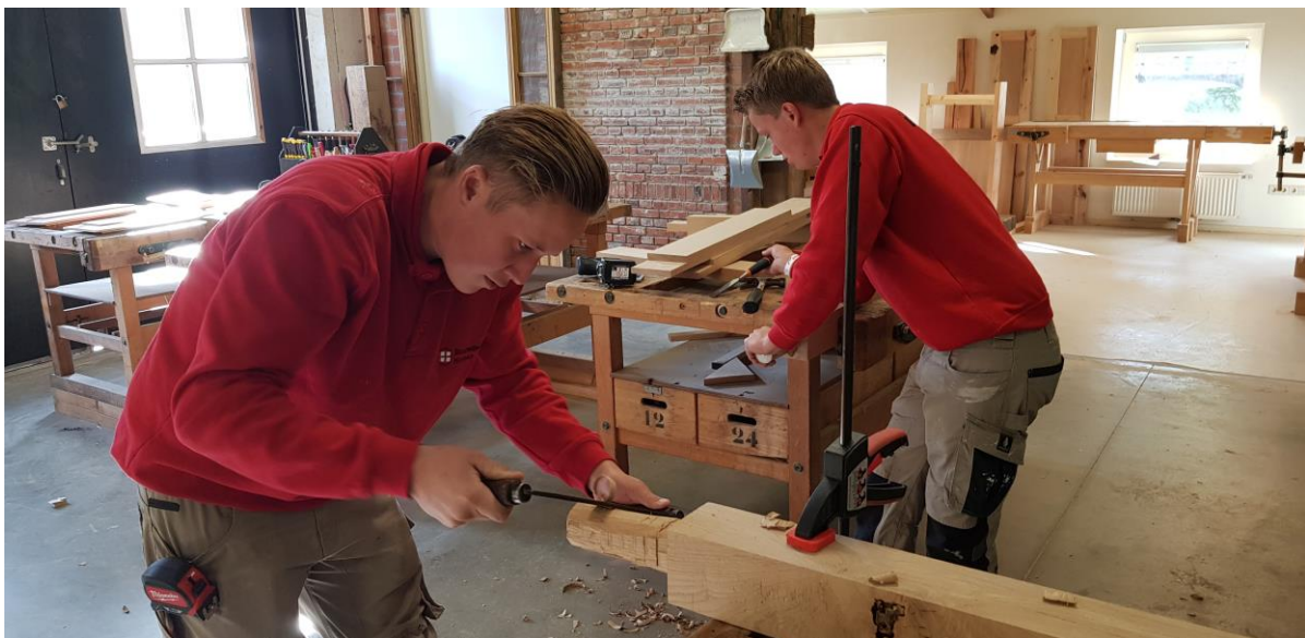
ROP Oost / RIBO: leerlingen restauratie-opleiding THR.

In 2020 is het Gelders Restauratiecentrum in samenwerking met ROC Graafschap College ook begonnen om de opleiding THR aan te bieden. Daar is gestart met 8 leerlingen. ROC De Leijgraaf in Veghel heeft meer dan serieuze plannen om de Opleiding THR te beginnen. Het afgelopen jaar is bij het ministerie van OCW de vergunning hiervoor aangevraagd. Deze is beginsel gehonoreerd. Om tot een steviger fundament voor restauratieopleidingen in Noord-Brabant te komen zijn de besprekingen over het aanbieden van de opleiding THR inmiddels verbreed naar andere ROC's in de provincie. ROP-Zuid is hier nauw bij betrokken. Het streven is om in 2021 tot een concrete uitwerking te komen. In Noord-Holland zijn het afgelopen jaar eveneens verkennende gesprekken gevoerd om in Zaandam of in Amsterdam de THR-opleiding te starten.