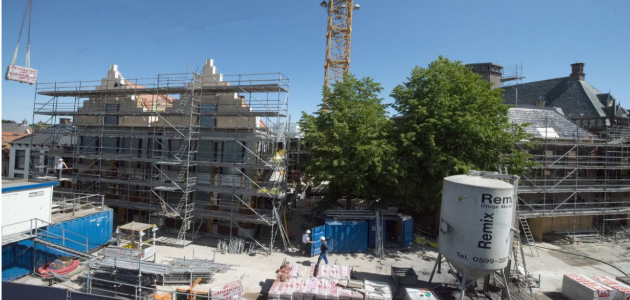
Project ROP NN: verbouw stadhuis Bolsward tot cultuurhistorisch centrum.