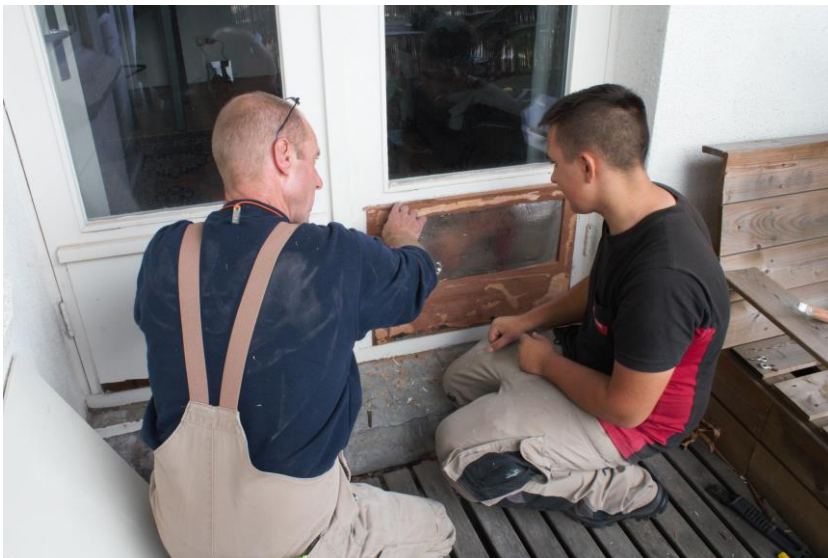
ROP Zuid: leermeester met leerling.

Omdat er in Limburg geen enkele restauratieopleiding op niveau 3 of niveau 4 is, richt ROP Zuid zich hier vooral op kennismakingsstages op restauratieprojecten. Vervolgens wordt geprobeerd geïnteresseerde leerlingen onder te brengen bij restauratiebedrijven, waar ze in de praktijk verder worden bekwaamd en de fijne kneepjes van het vak aangeleerd krijgen. Daarentegen beschikt ROP Oost / RIBO over een eigen restauratieopleiding en is het streven logischerwijs om leerlingen een complete MBO-opleiding te laten doorlopen met een officieel diploma als afsluiting.