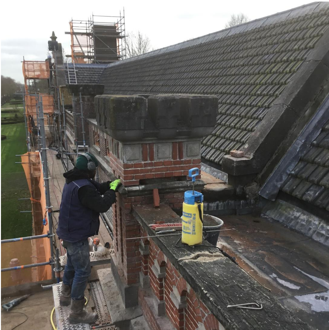
ROP NN: verbouw kazerne.